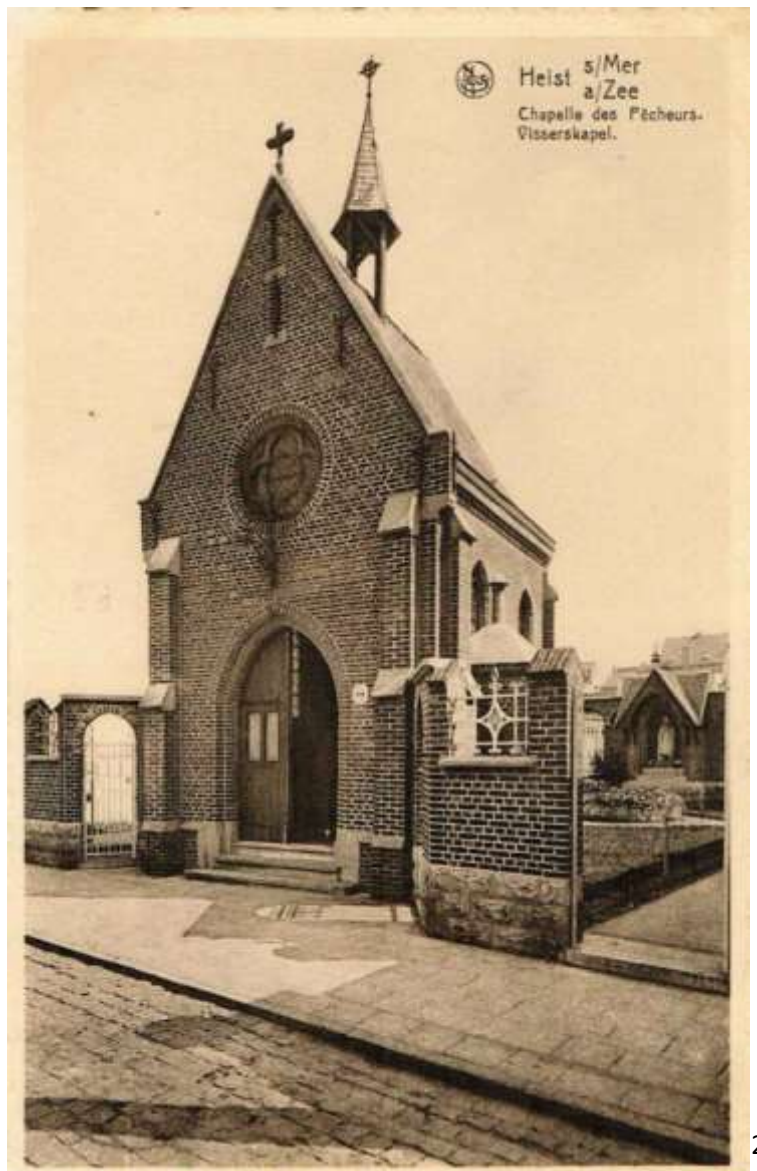
Heist s/ Mer a/ Zee Chapelle des Pêcheurs- Visscherskapel.

Daarom zal het beeld op een plecht (20 cm) geplaatst worden bij de eeuwfeestviering in 1992.